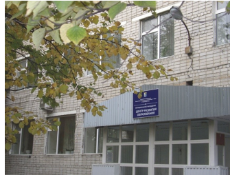
Муниципальное бюджетное учреждение «Центр развития образования»

В 2011 году МБУ «Центр развития образования» исполнилось 5 лет. Это первый юбилей учреждения!