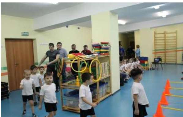
Рисунок № 12 «Посвящение в пожарные»