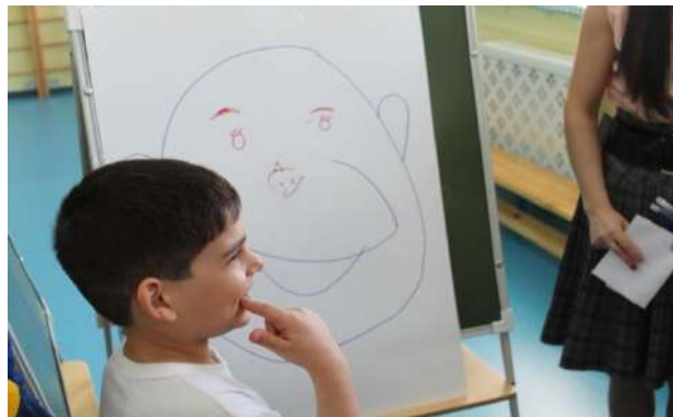
Рисунок № 4 «Веселые старты»

Совместно с МБОУ «СШ № 30 с углублённым изучением отдельных предметов» и муниципальным учреждением дополнительного образования «Патриот» был проведен смотр строя и песни среди воспитанников старших и подготовительных групп в рамках сотрудничества и помощи в реализации программы военно-патриотического воспитания. Смотр строя и песни планируется проводить ежегодно в подготовительных группах.