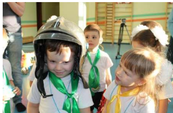
Рисунок № 11 «Посвящение в пожарные»