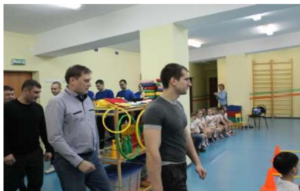
Рисунок № 13 «Посвящение в пожарные»