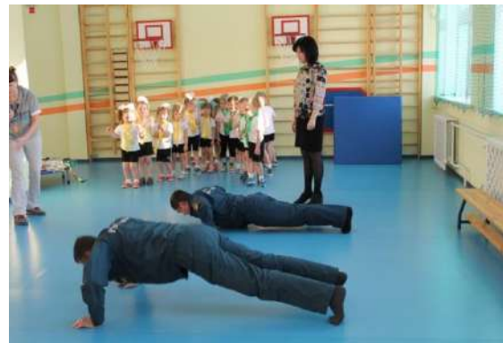
Рисунок № 9 «Посвящение в пожарные»