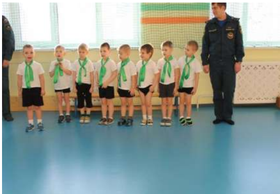
Рисунок № 8 «Посвящение в пожарные»