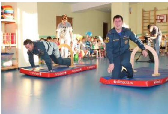
Рисунок № 10 «Посвящение в пожарные»