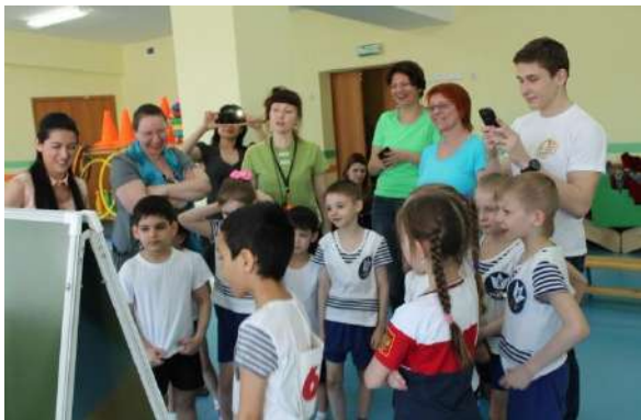
Рисунок № 3 «Веселые старты»