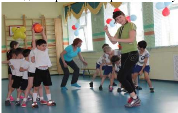
Рисунок № 1 «Веселые старты»

В ежегодных, уже ставших традиционными, соревнованиях «Весёлые старты» между воспитанниками МАДОУ № 40 «Золотая рыбка» и МАДОУ № 60 «Золушка», команда воспитанников нашего детского сада ежегодно улучшает свои результаты. С апреля 2017 года детские сады № 40 и № 60 ежегодно борются за переходящий кубок.