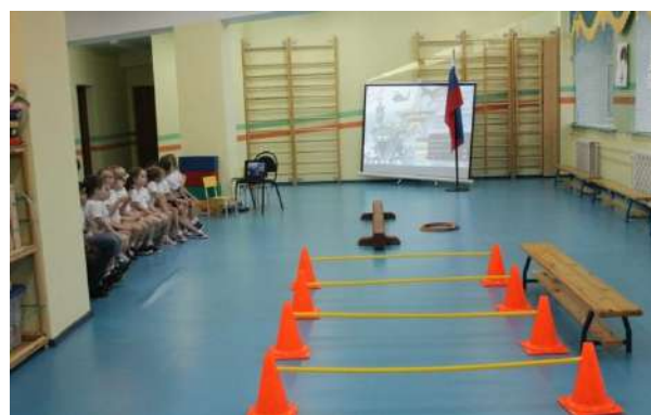
Рисунок № 15 «Посвящение в пожарные»

Стремясь к реализации общероссийской Программы «Школа Нации» и Всероссийского Комплекса «Готов к труду и обороне» проводим совместные спортивно-массовые мероприятия в ДОО с воспитанниками и их родителями, таких как «А ты готов к сдаче норм ГТО?» с привлечением студентов