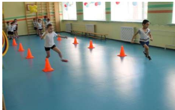
Рисунок № 2 «Веселые старты»