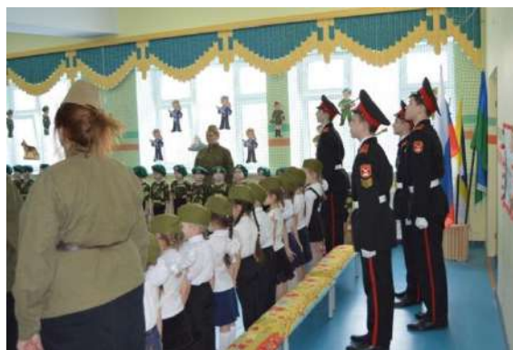
Рисунок № 7 «Смотр строя и песни»

Уже несколько лет в тесном содружестве, в рамках программы ДОУ «Юный спасатель», проходят спортивно-массовые мероприятия с воспитанниками ДОУ, их родителями и сотрудниками МЧС – «Посвящение в пожарные»; «Настоящее и будущее России» – в рамках празднования 23 февраля.