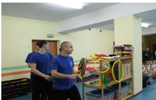
Рисунок № 14 «Посвящение в пожарные»