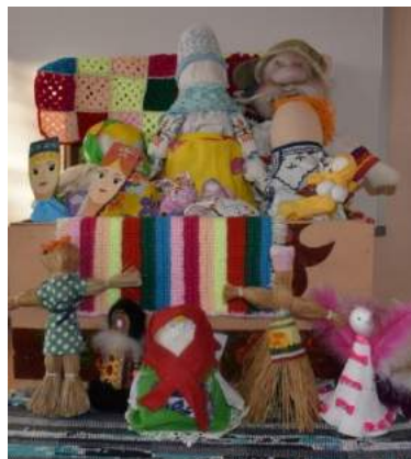
Рисунок 5 Музей-игротека «Бабушкин сундучок»

Музей-игротека «Бабушкин сундучок»: в качестве игрового материала используются куклы, изготовленные руками детей и родителей.