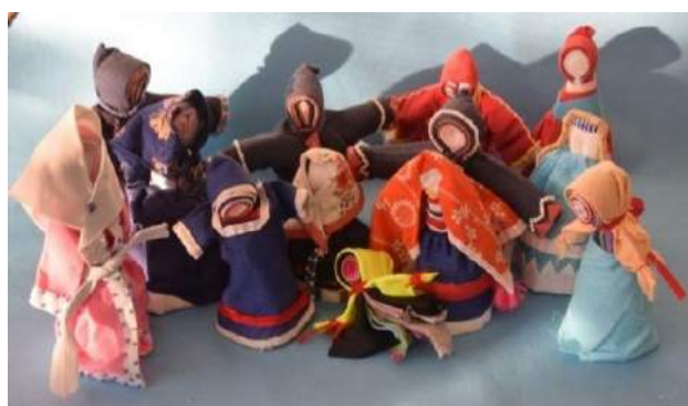
Рисунок 4 Музей-мастерская «Кукла Акань»

Музей-мастерская «Кукла Акань»: в экспозиционное пространство музея включаются рабочие зоны для творческой деятельности для изготовления народных кукол.