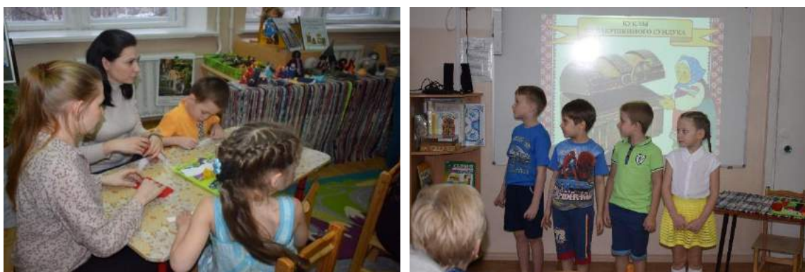
Рисунок 8-9 Кукла как часть социокультуры

Очень важно научить детей любить и ценить Югорскую землю, как любят ее представители коренных народностей. Знания о городе, в котором ты родился, об округе, в котором живешь, о его коренных жителях, растительном и животном мире эстетически и духовно обогатят ребенка. Реализация этнокультурных программ способствует формированию элементов национального самосознания старших дошкольников, где основными показателями могут выступать: национальная идентификация, национальные стереотипы, эталоны поведения, национальные (моральные) ценности.