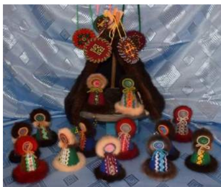
Рисунок 3 Музей-выставка «Моя Югра»

Музей-выставка «Моя Югра»: экспозиция музея представляет собой комплекс предметов, размещённых в закрытых витринах и шкафах, малодоступных для интерактивного использования.