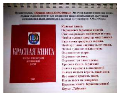
Рисунок 10,11,12 Материалы краеведческих информационно-познавательных журналов «Югорчата»