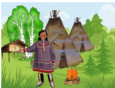
Рисунок 1 «Зоя Вагатова – анимационная героиня»

С помощью неё дети узнают, как живёт хантыйская семья, о промыслах обских угров, чем они любят заниматься в свободное время.