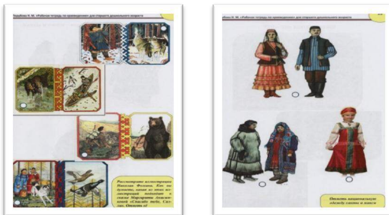
Рисунок 2 Материалы рабочей тетради «Югорчата»

Успешность реализации Программы «Югорчата» зависит от создания развивающей этнокультурной среды, с помощью которой ребёнок как бы входит в мир национального фольклора, языка, уклада жизни. Обогащение предметно-пространственной среды как составляющей образовательного пространства осуществляется за счёт создания разнообразных мини-музеев этнокультурной направленности.