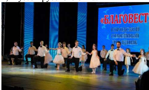
Рисунок 13 Танец с папами на городском семейном празднике «Благовест»