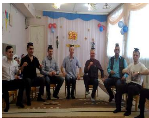
Рисунок 19 Праздничное мероприятие с папами, посвященное Дню защитника Отечества