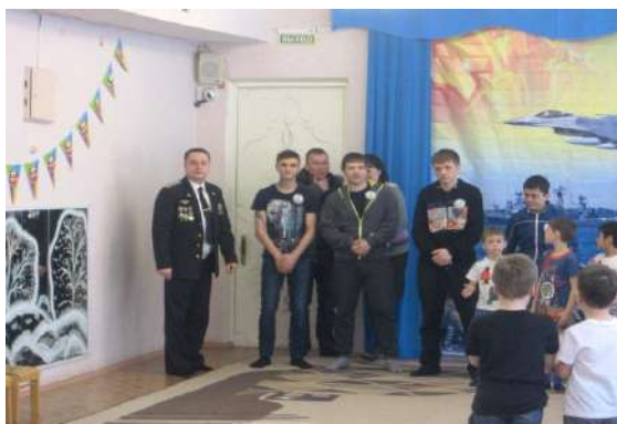
Рисунок 10 Праздничное мероприятие «Мой папа для меня герой!»

Направление « Пресс-центр » представлено такими блоками, как: