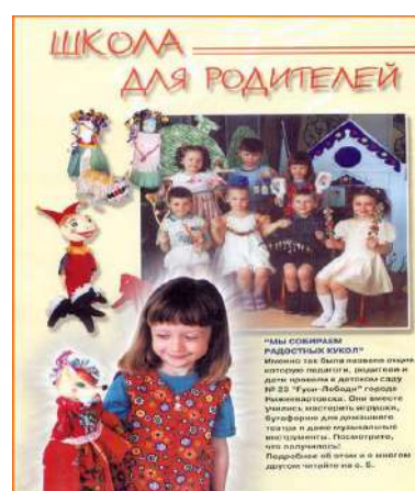
Рисунок 12 Публикация в журнале «Книжки, нотки и игрушки для Катюшки и Андрюшки»

Направление « Внешняя политика » представлено такими блоками, как: