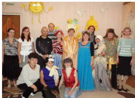
Рисунок 2 Актеры театральной постановки «Репка»

Направление «Семейный досуг» представлено такими блоками, как: