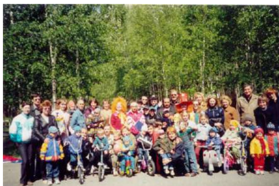
Рисунок 16 Городской семейный праздник юных велосипедистов

В рамках сотрудничества особое внимание уделяется формированию культуры отцовства. Первостепенной целью процесса взаимодействия дошкольного образовательного учреждения с отцами мы видим в развитии их педагогической компетентности как родителей дошкольников. В рамках сотрудничества реализуется система неформального психолого-педагогического взаимодействия, которая строится на реализации комплекса лекционных субботних занятий и занятий на родительских пятницах. В качестве эффективных форм взаимодействия с родителями можно выделить следующие: