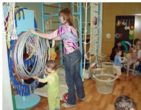
Рисунок 6 Семейный десант «Физкультура, или Путешествие в мир здоровья»

Направление « Встреча с интересным человеком семьи » представлено такими блоками, как: