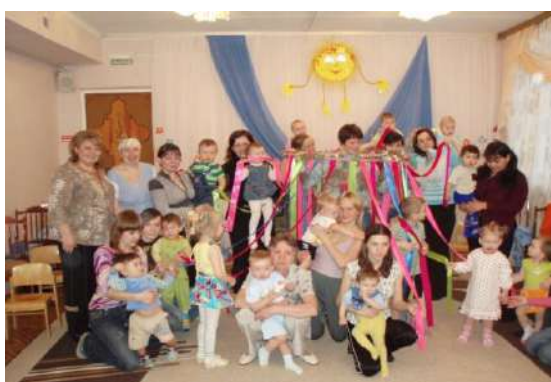
Рисунок 15 Семейный досуг в ДОУ «Вместе дружная семья»