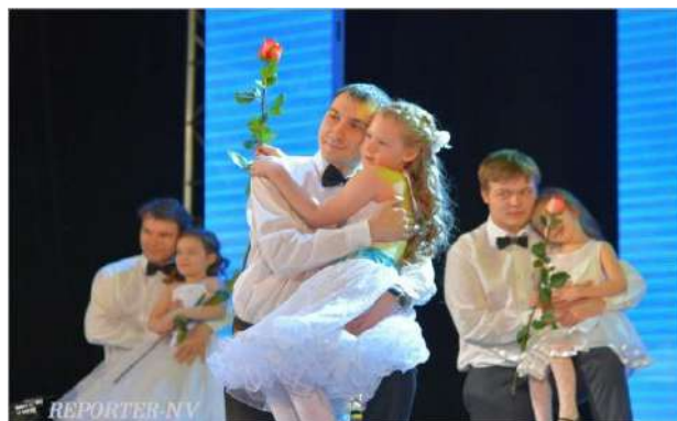
Рисунок 23 На региональном фестивале «Папа может»