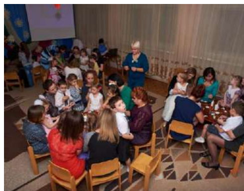
Рисунок 4 Творческая мастерская «Золушка»

Направление «Здоровая семья – здоровый ребенок» представлено такими блоками как: