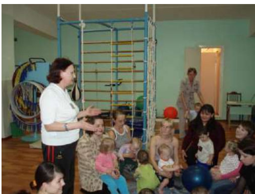
Рисунок 5 Воскресный абонемент «Твори, выдумывай, пробуй»