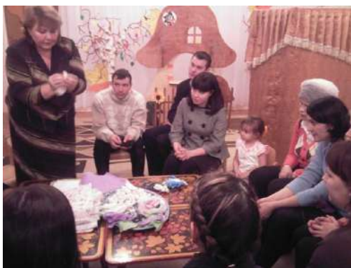
Рисунок 3 Творческая мастерская «Сундучок Самоделкина»