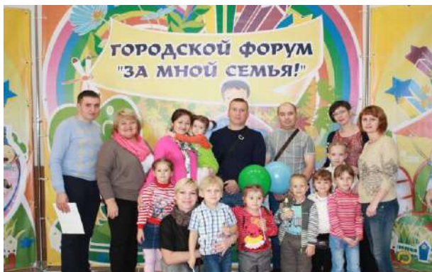
Рисунок 22 На городском мероприятии «Благовест»

Благодаря работе детско-родительского оркестра «Коробейники» отцы стали активными участниками в различных городских семейных мероприятиях, таких, как городской форум «За мной семья!».