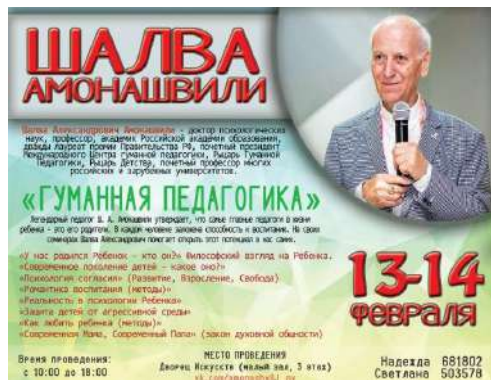
Рисунок 17 Афиша семинара Ш. Амонашвили

3. Участие в концертных номерах праздничных мероприятий, посвященных Дню Защитника Отечества.