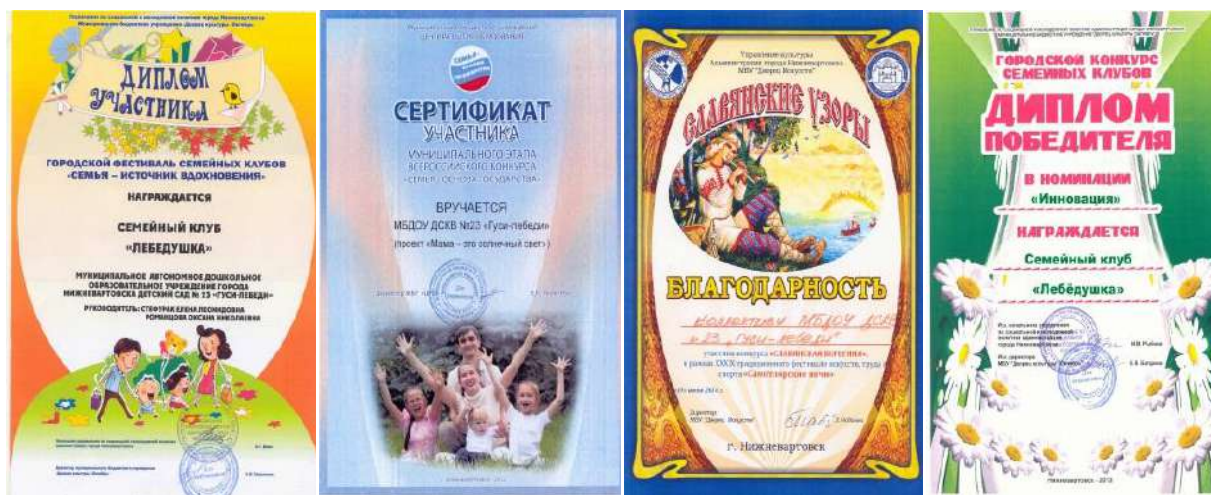
Рисунок 14 Дипломы и благодарности семейного клуба «Лебедушка»