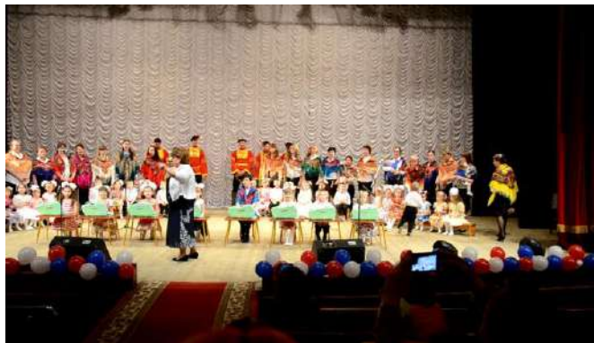
Рисунок 21 Выступление семейного оркестра «Коробейники»

Оркестр – это не только группа музыкантов, играющих вместе, а такая форма коллективного исполнительства, где каждый, сохранив индивидуальность, вместе с тем подчиняется общим задачам в воплощении авторского замысла. Цель, которая ставится перед любым детско-родительским оркестром, – не столько научить играть на инструменте или вырастить будущую знаменитость, сколько создать такую среду, где бы каждый участник развивался как личность, развивались их способности и дарования.