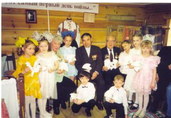
Рисунок 9 Встреча с ветеранами ВОВ в Музее русского быта