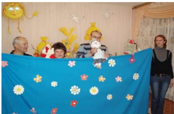
Рисунок 1 Семейная постановка «Два веселых гуся»