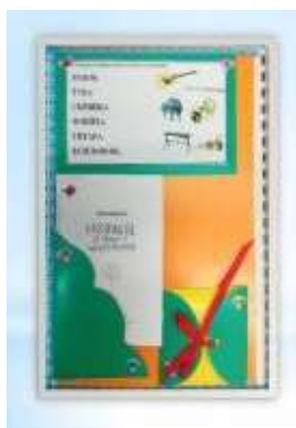
Рисунок 3. «Левый разворот»