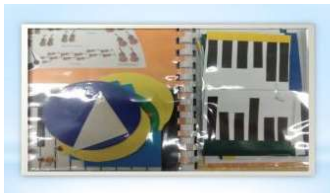
Рисунок 8. «Концерт с игровым материалом»

Ход игры: Ребенок слушает музыку и определяет, сколько в ней частей. Есть ли одинаковые части, и как часто повторяется. После этого выкладывает схему с помощью разноцветных фигурок: каждая часть обозначается кружком какого-либо цвета, а другая часть – другой фигурой. Во время повторного исполнения музыки, ребёнок выкладывает геометрические формы в той последовательности, которая соответствует строению прослушанной музыки.