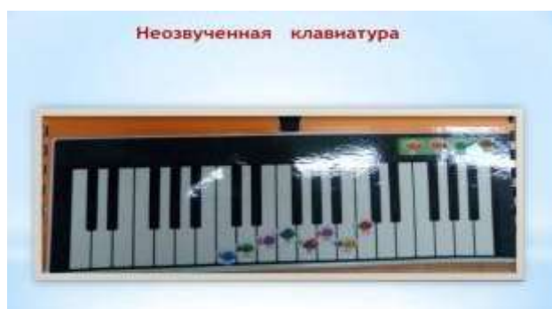
Рисунок 10. «Клавиатура»

Не озвученные инструменты играют большую роль в развитии малышей. Дети, представляя себя играющими на музыкальных инструментах, поют. Таким образом, не озвученные игрушки-инструменты упражняют детей в