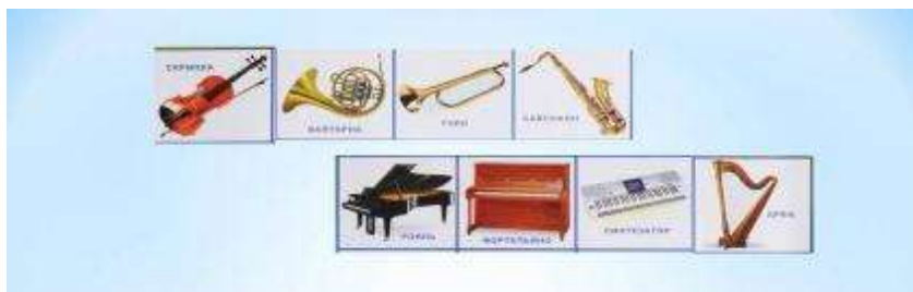
Рисунок 12. «Карточки с инструментами»

Игровой материал: Карточки с изображением групп музыкальных инструментов, фишки.