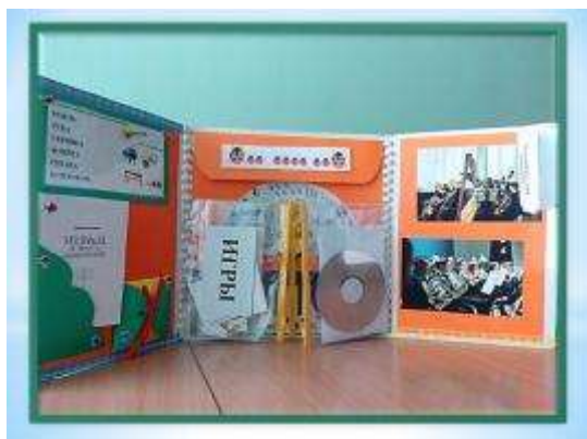
Рисунок 1. Полный разворот тематической папки

Я подготовила свой лэпбук как дидактическое пособие для детей старшего дошкольного возраста. Он представляет собой тематическую папку размером 30*30 см, и 2 разворота 25*30 см. На страницах папки имеются различные кармашки, конвертики, диски и карточки, в которых собрана информация по теме «Симфонический оркестр».