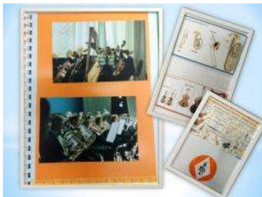
Рисунок 2. «Правый разворот»

Игры все красочные, прочные, часто используемые детали заламинированы.