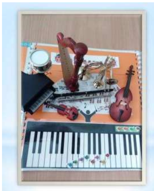
Рисунок 6. «Расположение инструментов на поле».