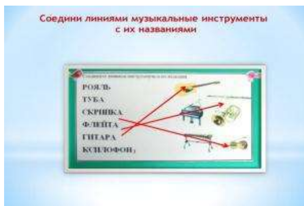
Рисунок 7. Схема к игре «Определи инструмент»

Ход игры: Ребенок маркером соединяет линиями изображения музыкальных инструментов с их названиями.