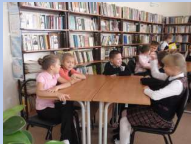
Викторина по книгам о Гарри Поттере (6-7 классы)